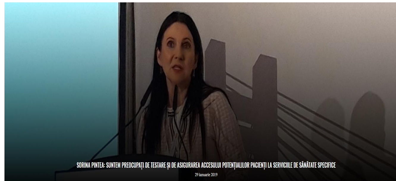
Sorina Pintea la #HepHIV2019

https://www.sanatateatv.ro/sorina-pintea-suntem-preocupati-de-testare-si-de-asigurarea-accesului-potentialilor-pacienti-la-serviciile-de-sanatate-specifice